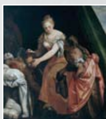
„GIUDITTA E OLOFERNE“, PAOLO VERONESE, 1581