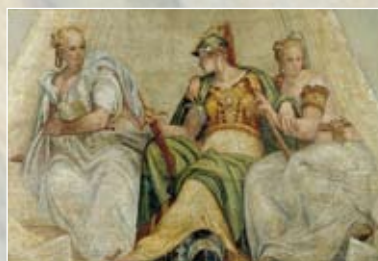
„MINERVA TRA LE GEO- METRIE E L'ARITMETICA.“ PAOLO VERONESE

Cena a buffet con intrattenimento musicale Premiazione poster sessione odontoiatri