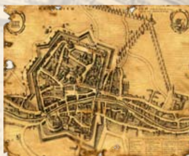
MAPPA MEDIEVALE DI VERONA