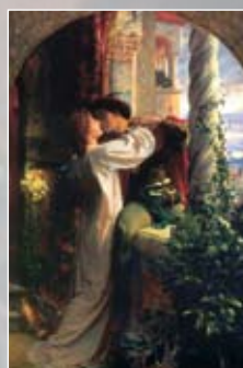
„ROMEO AND JULIET.“ FRANK DICKSEE

ore 19.00 Cena a buffet con intrattenimento musicale Premiazione poster sessione odontotecnici